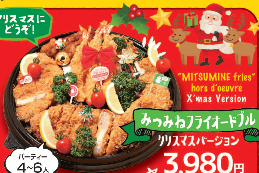
"MITSUMINE fries" hors d'oeuvre X'mas Version