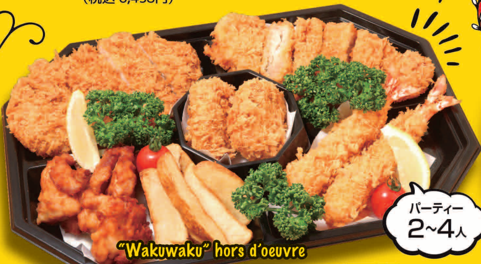
"Wakuwaku" hors d'oeuvre