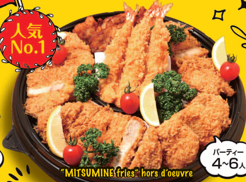
"MITSUMINE fries" hors d'oeuvre